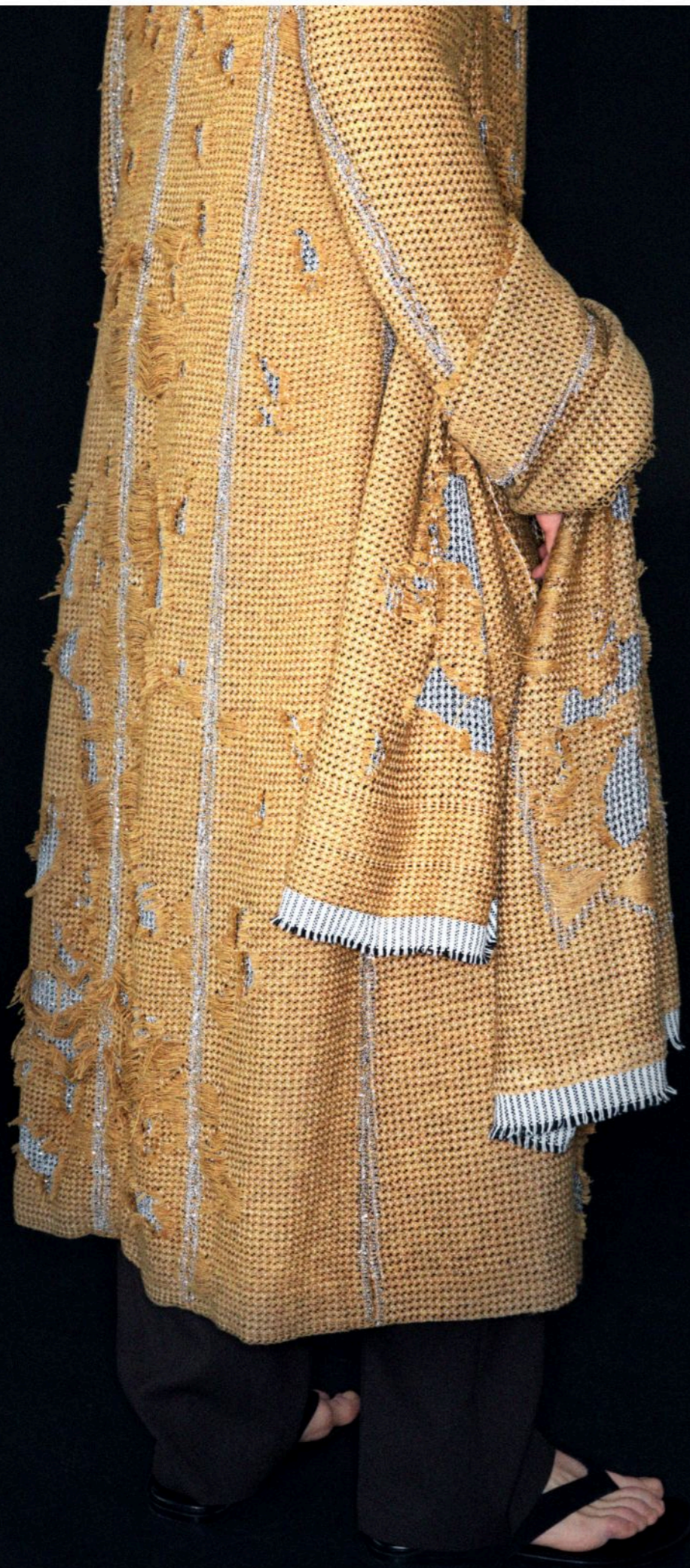
03 Coat Woven wool and stainless steel chain