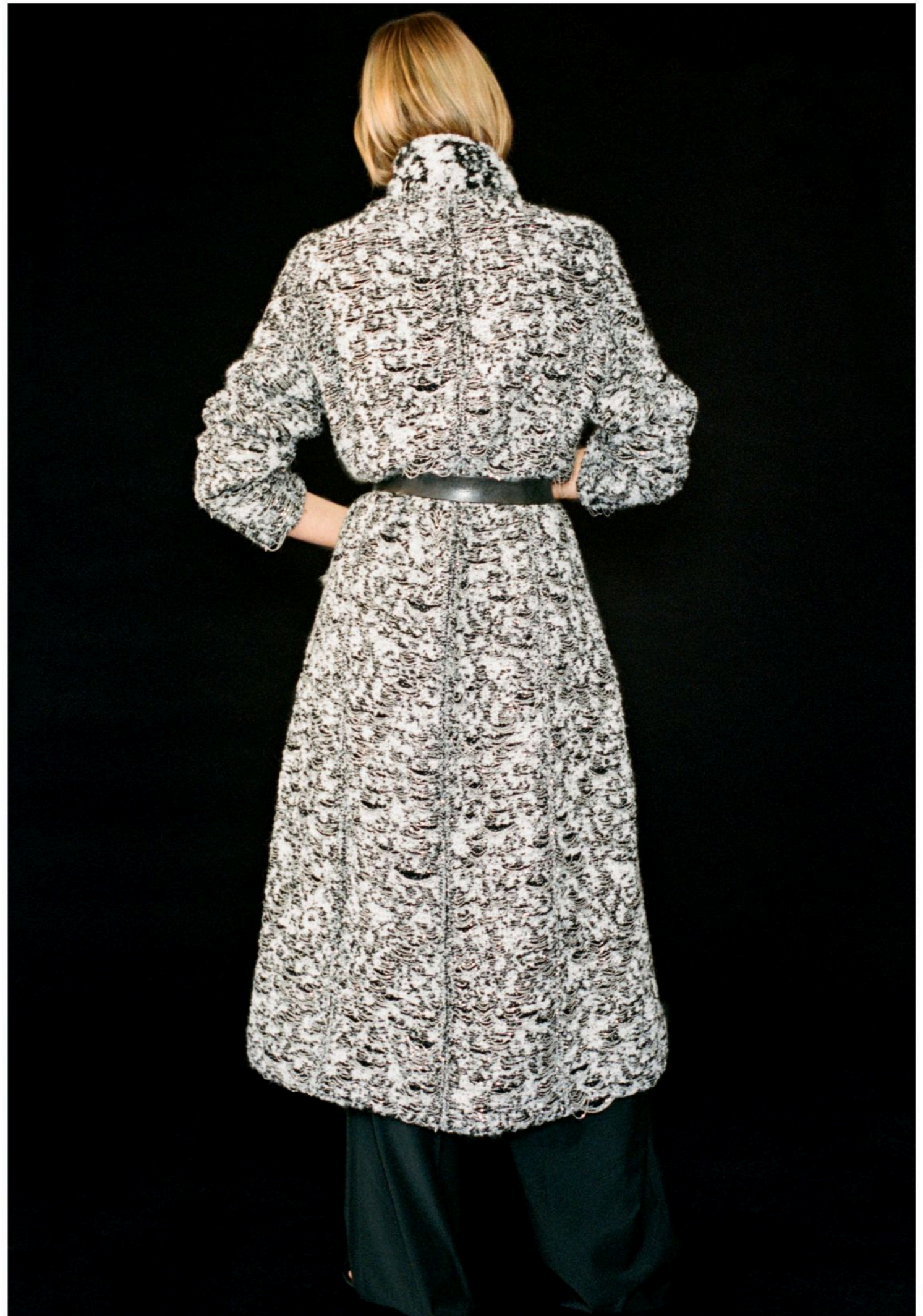
01 Coat Woven wool and stainless steel chain