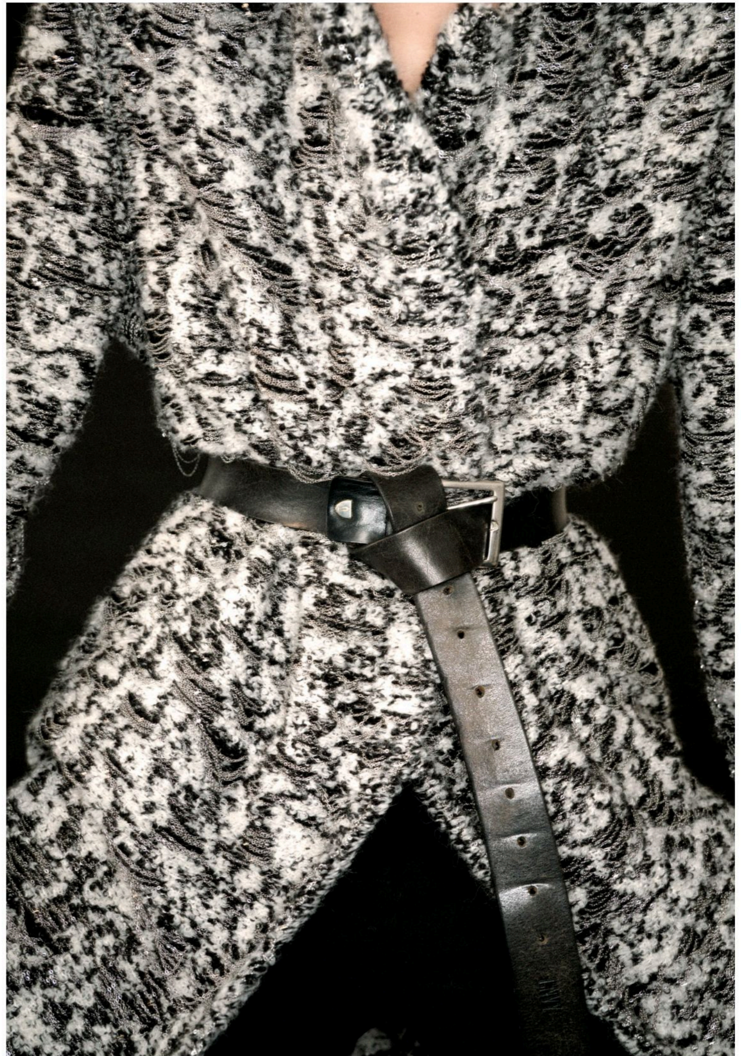
Coat 01 Woven wool and stainless steel chain