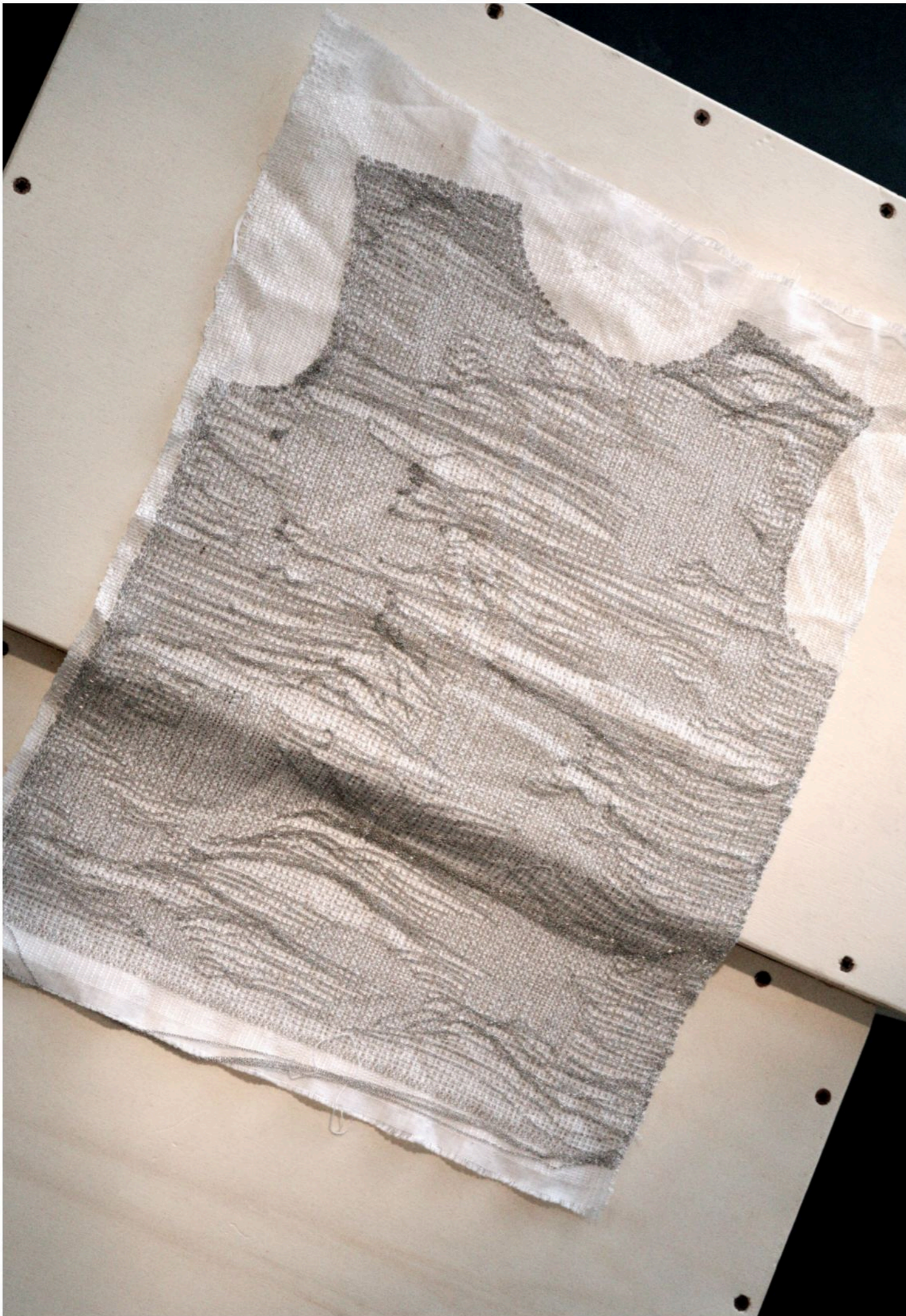
05 Vest Woven wool and stainless steel chain